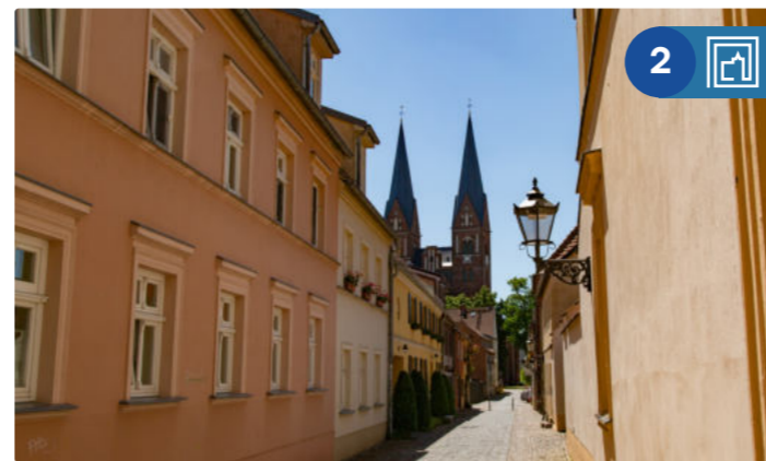
Blick auf die Klosterkirche St. Trinitatis in Neuruppin

Route 2: Fontanes Zauberschloss und der Traum vom Fliegen