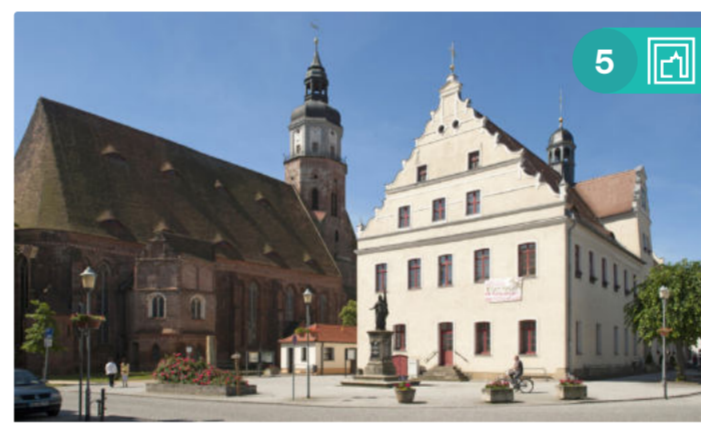
Altstadt von Herzberg/Elster mit Rathaus, Marktplatz und St. Marienkirche

Route 5: Mönche, Macht und Meinungsstreit