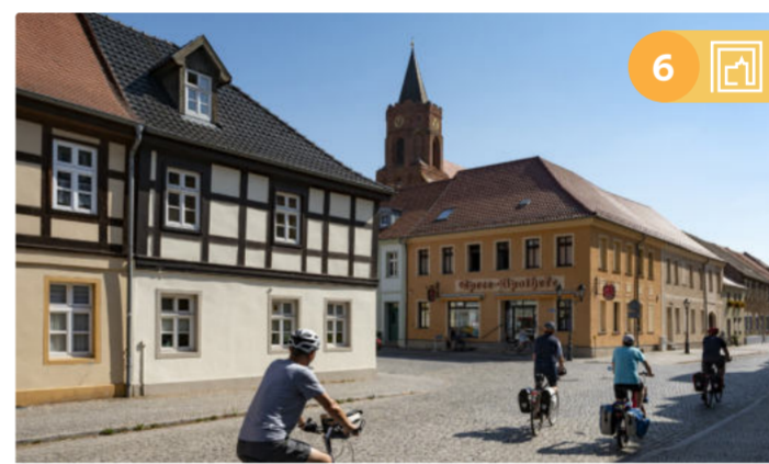
Blick auf die St. Marienkirche in Beeskow

Route 6: Handwerk, Schlösser, Festungsmauern