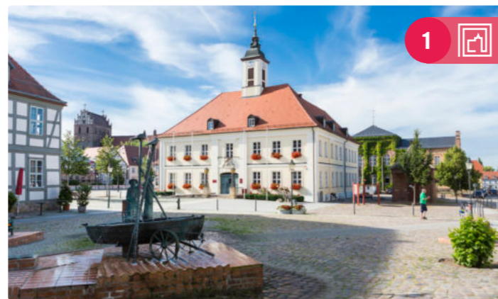
Marktplatz von Angermünde

Route 1: Kronprinzen, Kurfürsten und Kurbäder