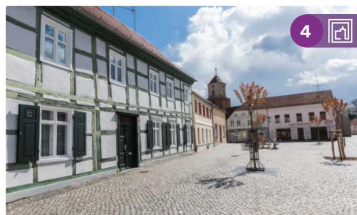
Fachwerkarchitektur in Treuenbrietzen

Die Radroute Historische Stadtkerne Nummer 4 beginnt in Potsdam und führt dich durch Brandenburg an der Havel. Weiter geht es entlang der glitzernden Havelseen zur Burg Ziesar und hinein in die Wälder des Hohen Fläming mit dem Schloss Wiesenburg sowie den Burgen Rabenstein und Eisenhardt. Unterwegs begegnest du Wahrzeichen wie dem Brandenburger Dom, der von der Eroberung der Mark kündet. Du radelst vorbei an manch hoch aufragenden Bürgertürmen und erfährst vom Luxusleben der Bischöfe in der Burgkapelle Ziesar sowie von mittelalterlichen Fürstentreffen in der Stadt Jüterbog. Am Kloster Zinna vorbei, weiter durch die Spargelstadt Beelitz, endet deine Radtour schließlich inmitten der Potsdamer Havellandschaft.