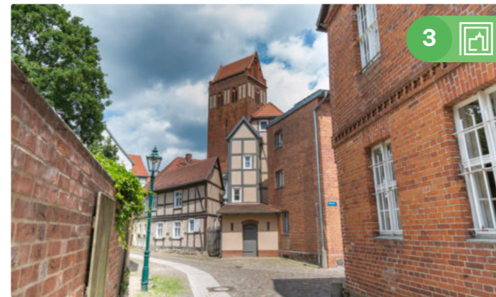
Ceglany kościół halowy św. Jakuba w centrum Perleberg

Trasa nr 3: Szlaki wodne, handlowe i pielgrzymkowe