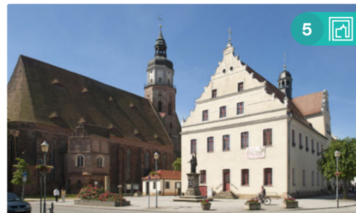
Stare miasto w Herzberg / Elster z ratuszem, rynkiem i kościołem św. Marii

Ponad 500 lat temu Marcin Luter napisał swoje tezy, które zmieniły bieg historii. Punktem zapalnym reformacji był handel odpustami Johanna Tetzeli w mieście Jüterbog w regionie Fläming.