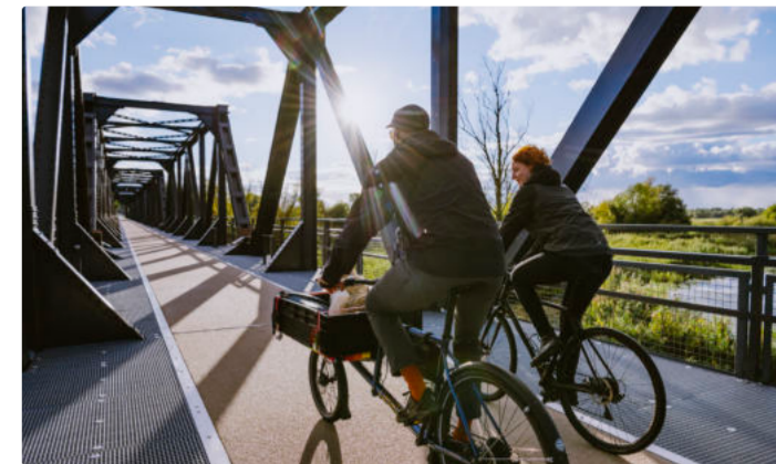
Most Europejski – Neurüdnitz-Siekierki

Wycieczki rowerowe po obu stronach granicy