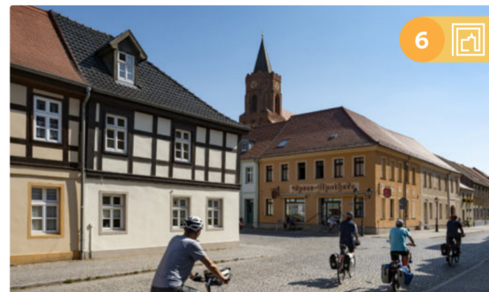
Widok na kościół św. Marii w Beeskow

Trasa nr 6: Rzemiosło, zamki, mury obronne