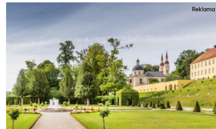
Widok na barokowy ogród klasztorny w klasztorze Neuzelle

Klasztor Neuzelle to jeden z największych skarbów Brandenburgii. Podczas wycieczki rowerowej szlakiem Odra-Nysa klasztor Neuzelle lśni już z daleka na horyzoncie. Krótki jazd z trasy rowerowej naprawdę się opłaca, po kilku minutach dotrzesz do jednego z nielicznych w pełni zachowanych kompleksów klasztornych w Europie.