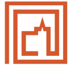
Rathenower Torturm ohne Licht- und Klangin- stallation