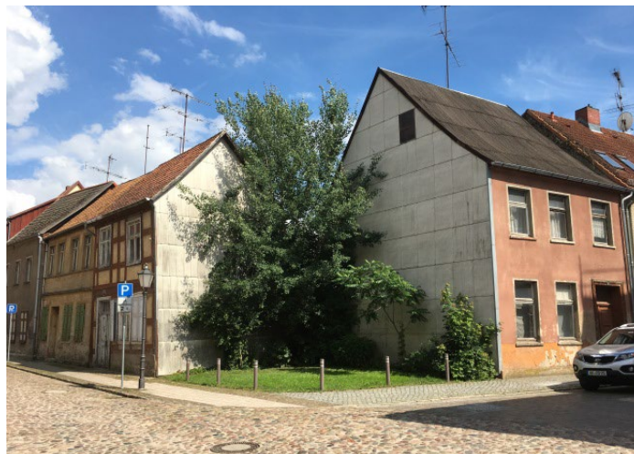
Heiligegeiststraße 18 mit Blick auf das gesamte Ensemble