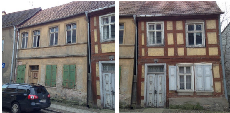
Heiligegeiststraße 14 und 16