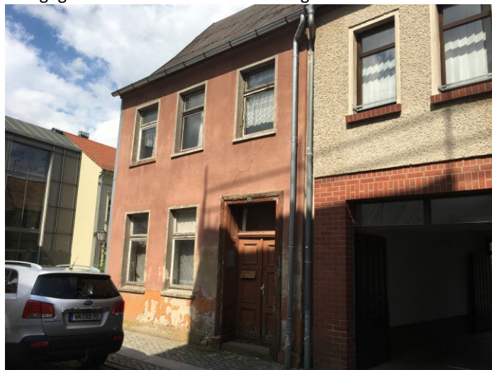
Am Rosenwinkel 15