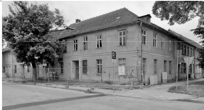
Bild vor Sanierung