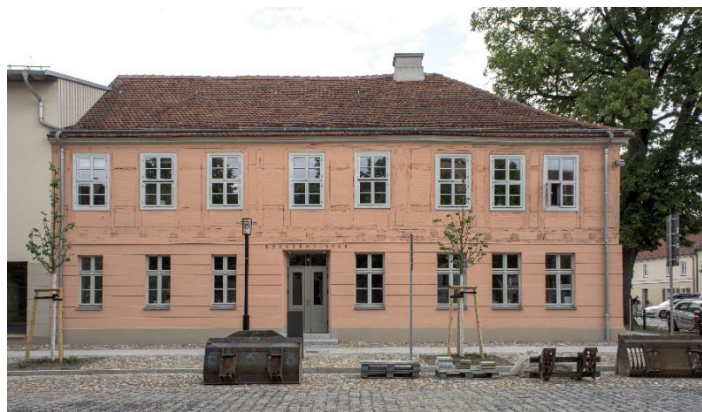
Bild nach Sanierung